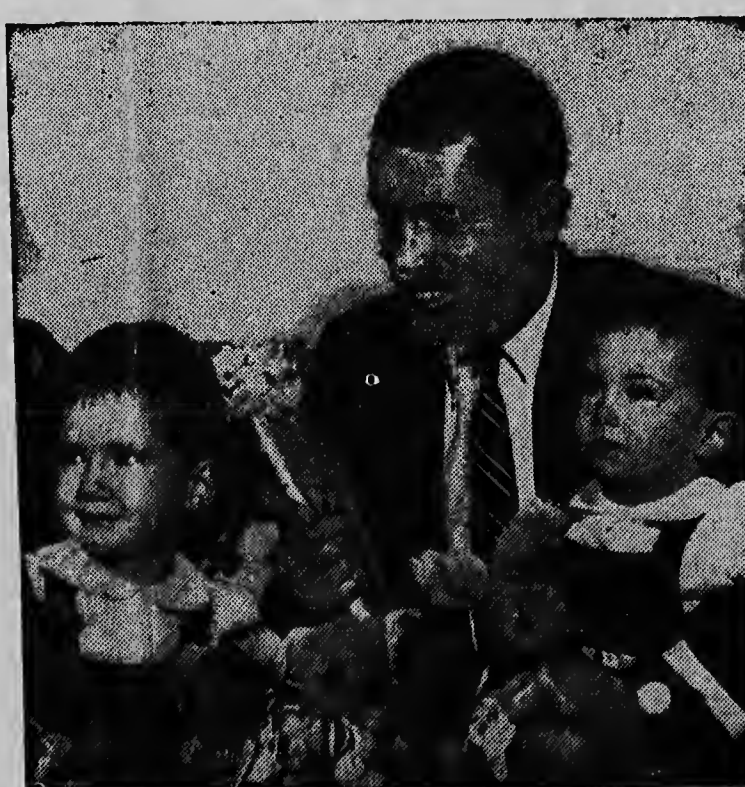
BILLY TALBERT, Captain van het Amerikaanse Davis Cup Team, keerde naar New York terug, nadat hij in Australië beslissend was verslagen. Ondanks zijn nederlaag, werd hij door zijn kinderen, 2 en 4 jaar oud, hartelijk ontvangen.

Het zou in zijn bedoeling liggen zich later geheel op Aruba te vestigen.